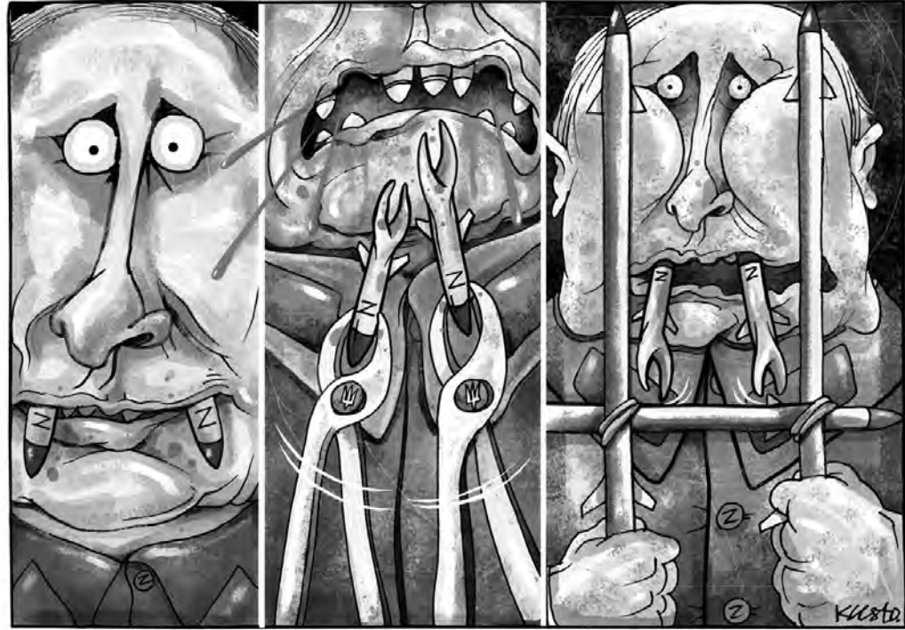
Викорінення та повернення зла (імплантація).