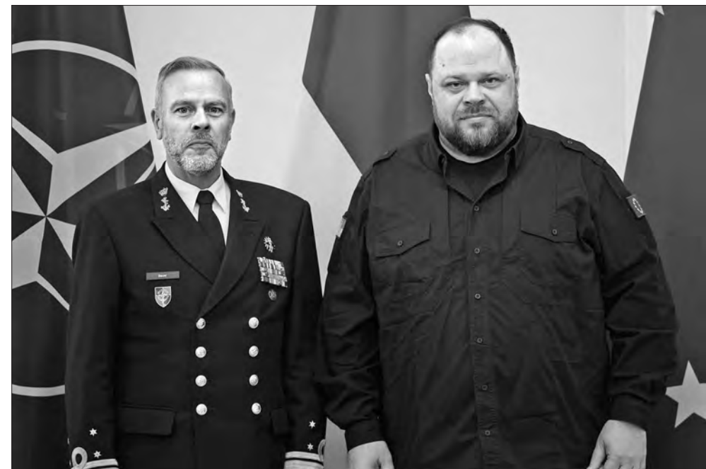
Під час зустрічі Голова Верховної Ради України насамперед наголосив, що членство України у НАТО є єдиним способом стримати майбутню російську агресію та зміцнити колективну оборону Альянсу.